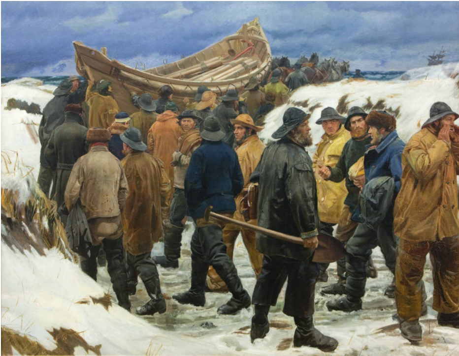
Michael Ancher, Redningsbåden køres gennem klitterne , 1883

Sal 222 – i Dansk og Nordisk Kunst 1750-1900