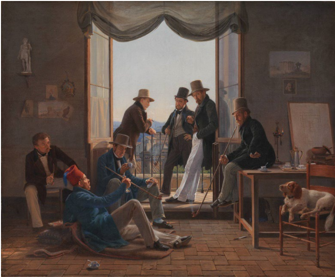
Constantin Hansen, Et selskab af danske kunstnere i Rom , 1837

Sal 218B – i Dansk og Nordisk Kunst 1750-1900