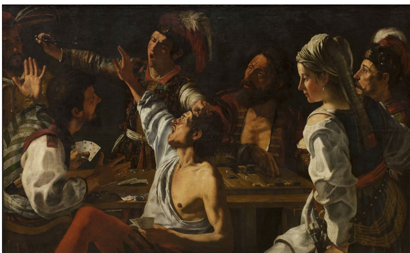
Theodoor Rombouts (tilskrevet), Kort- og brætspillere. Strid over et spil kort , 1616-1626

https://open.smk.dk/artwork/image/KMS7116?q=Marcus%20Tuscher%20familiegruppe&page=0